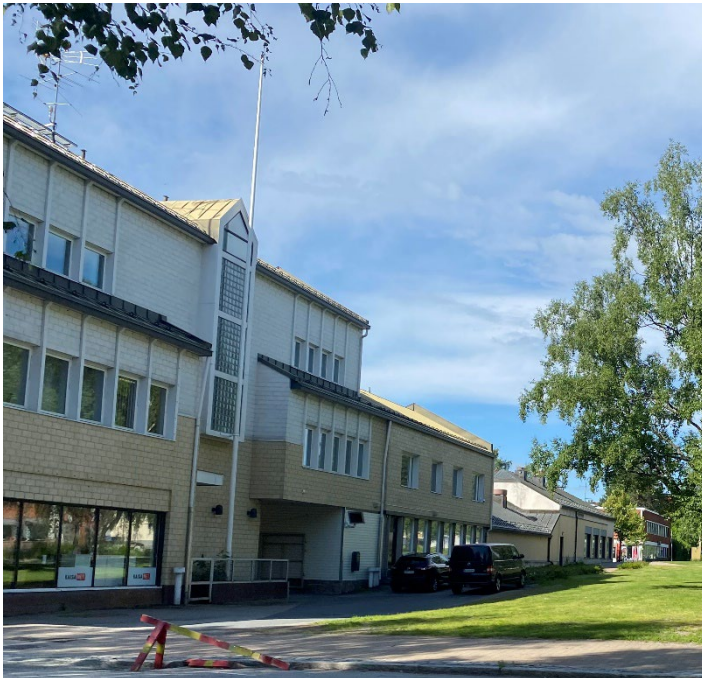
Kuva 7 Valokuva Kirkkopuistonkadun puoleinen julkisivu, kesä 2024.