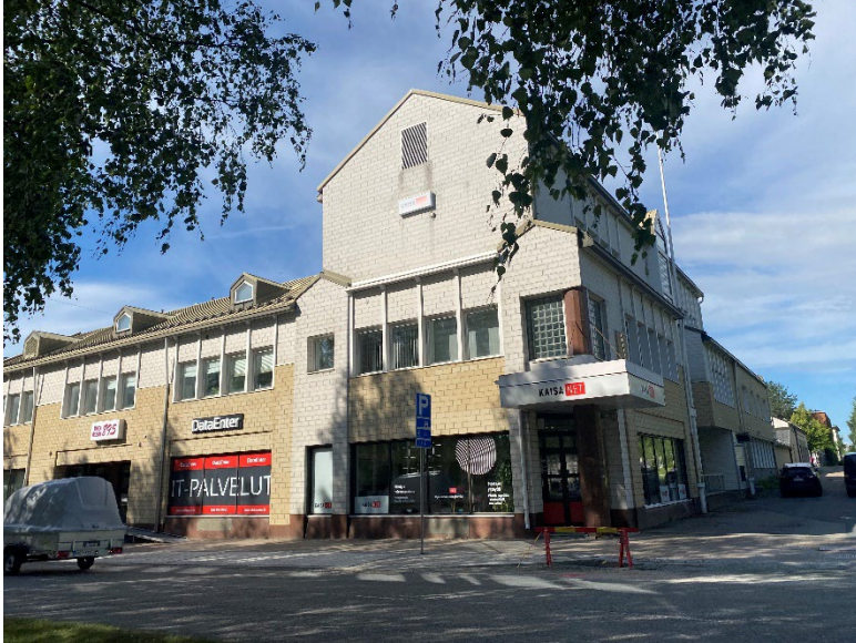
Kuva 6 Valokuva Pohjolankadun puoleinen julkisivu, kesä 2024