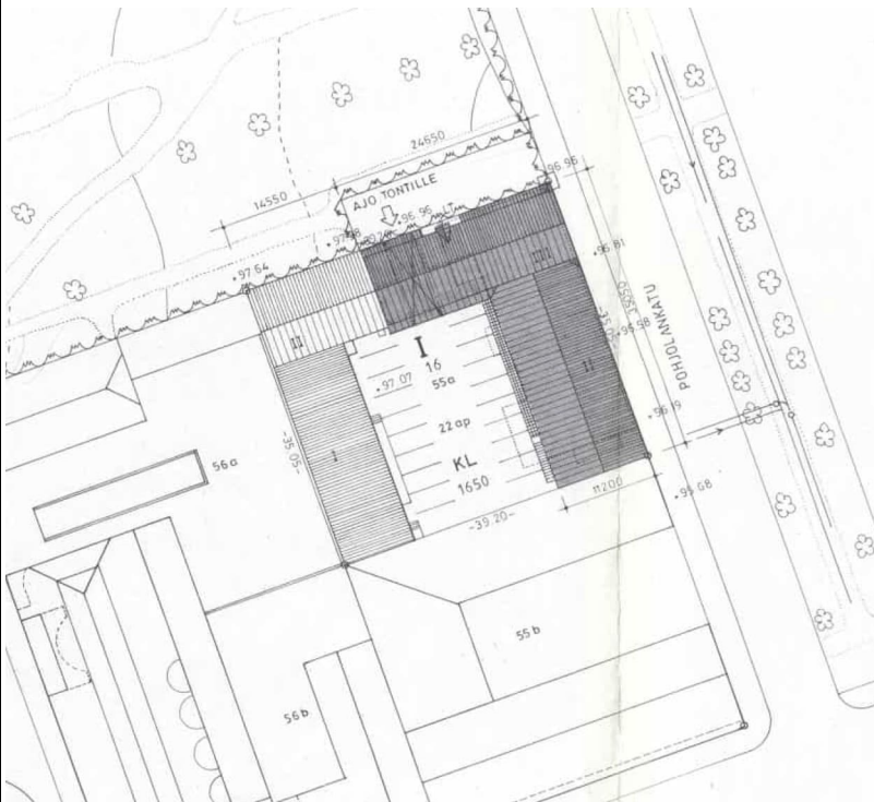
Kuva 3 Asemapiirros. Rakennuslupa v.1986.