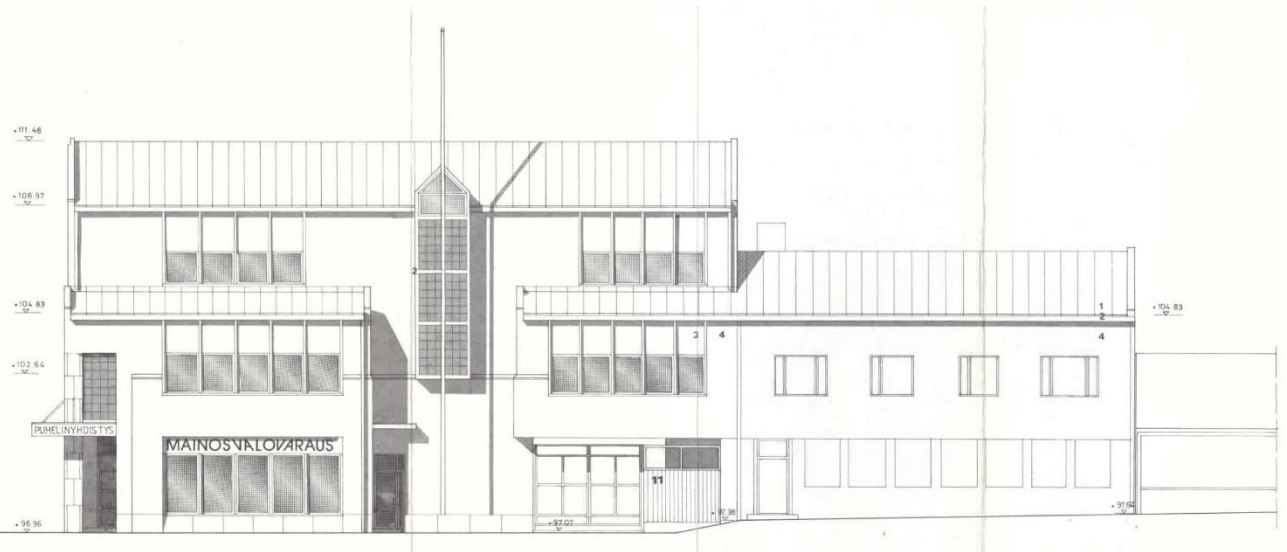
Kuva 4 Julkisivu Kirkkopuistonkadulle. Rakennuslupa v. 1986.