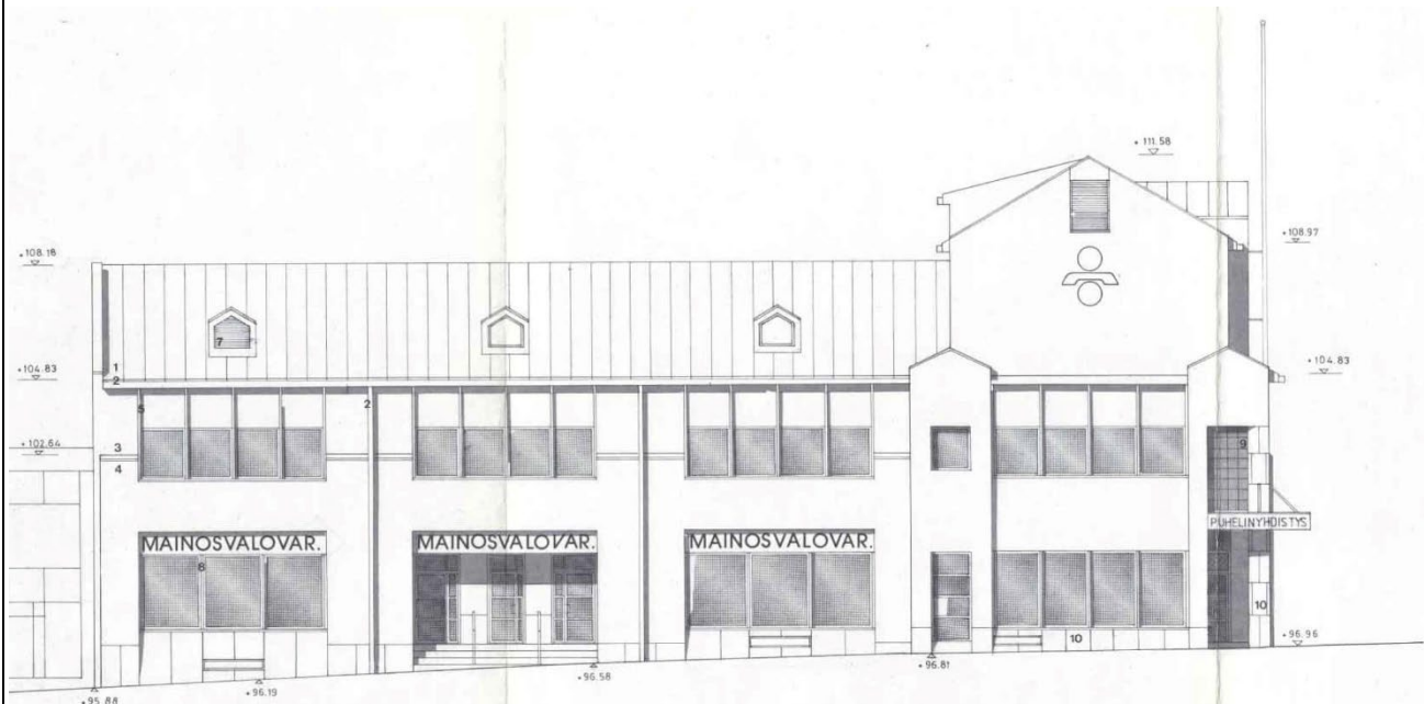
Kuva 5 Julkisivu Pohjolankadulle. Rakennuslupa v. 1986.