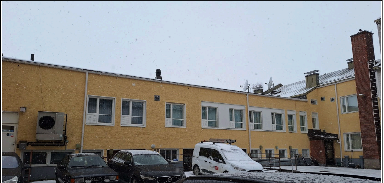
Kuva 8 Sisäpihan länsiosan julkisivu. (2025)

24. LÄHTEET JA SUULLISTA TIETOA ANTANEET