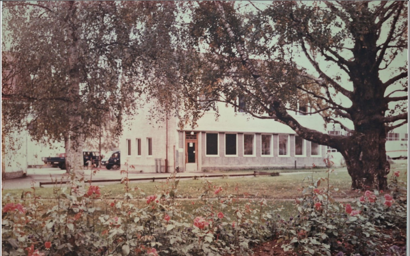
Kuva 2 Ote IPY:n tiloissa olevasta valokuvasta. Kuvan ottamisajankohta ei ole tiedossa.