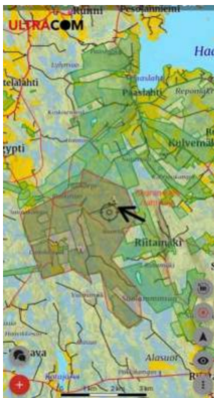
Kuva 4 Metsästysseuran kiinteistöt

Suuri huolenaiheemme on, että miten voimme jatkaa metsästystä alueellamme. Metsästystä ei tule rajoittaa!