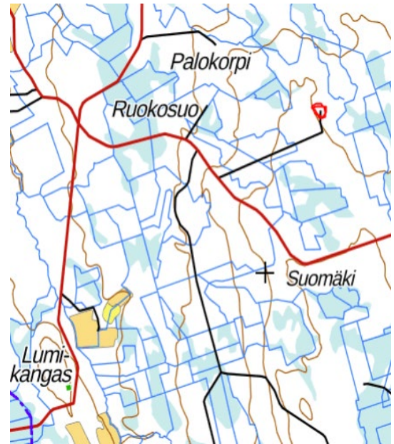
Kuva 2 Ruotaanmäen käämpä