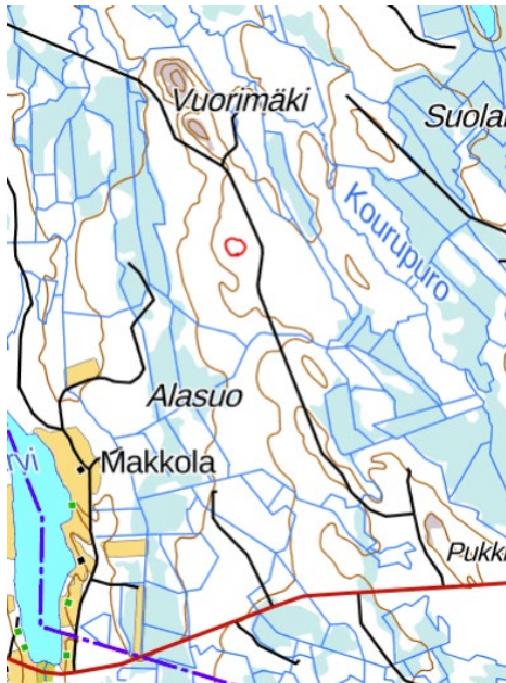
Kuva 1 Västinniemen käämpän kartta