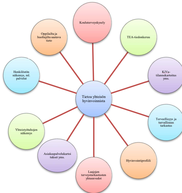
Kuvio 3. Tietoa yhteisön hyvinvoinnista

Koulun yhteisöllinen opiskeluhoitoryhmä kerää säännöllisesti tietoa oppilaiden ja kouluyhteisön hyvinvoinnista, terveydestä ja turvallisuudesta sekä suunnittelee näiden pohjalta toteutettavat toimenpiteet. Tehtyjen toimenpiteiden toimivuutta ja vaikuttavuutta seurataan ja arvioidaan.