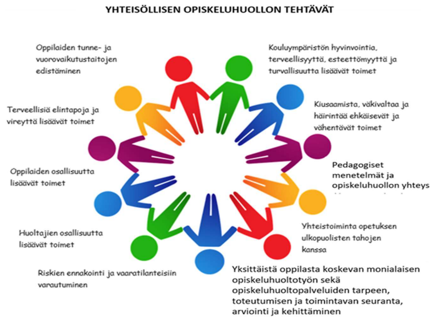
Kuvio 2. Yhteisöllisen opiskeluhoollon tehtävät

ennaltaehkäisyä, niiden varhaista tunnistamista ja tarvittavan tuen järjestämistä. (kuvio 2.)